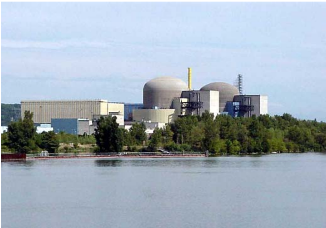
Photographie du site de Saint-Alban/Saint-Maurice

En 2011, les deux unités de production de la centrale nucléaire de Saint-Alban/Saint-Maurice ont produit 16,1 TWh. Cela représente cinq fois la consommation annuelle d'électricité d'une ville comme Lyon et 30% des besoins en énergie électrique de la région Rhône-Alpes (référence [8]).