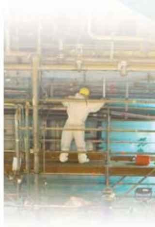
Table ronde n° 2 :