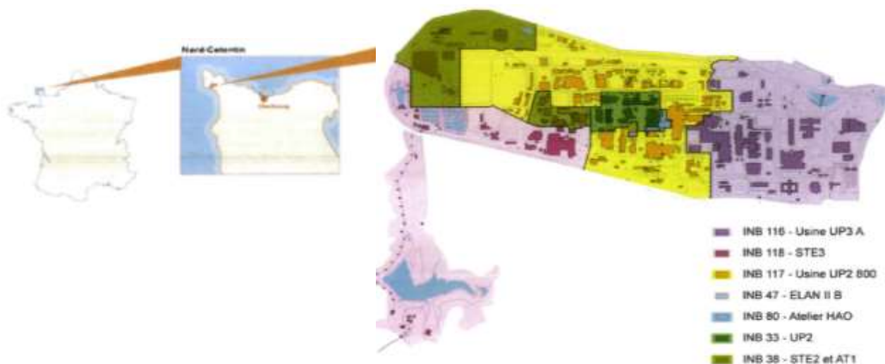
Figure 1 : Localisation de l'établissement Orano de La Hague et implantation de l'usine UP2-800

La localisation de l'établissement de La Hague et des INB qui sont implantées est présentée en figure 1.